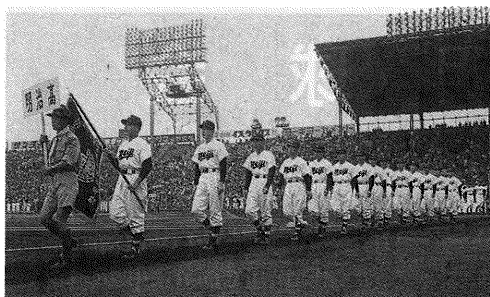
第30回選抜高等学校野球大会