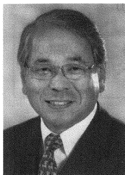
株式会社トミタ 代表取締役会長